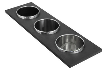
Set di 3 porta-bottiglie