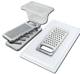
Kit grattugia con supporto per anello e vassoio di raccolta alimenti