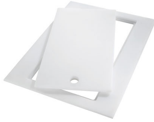
Tagliere Twin in HDPE