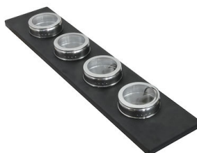
Set di 4 porta-spezie