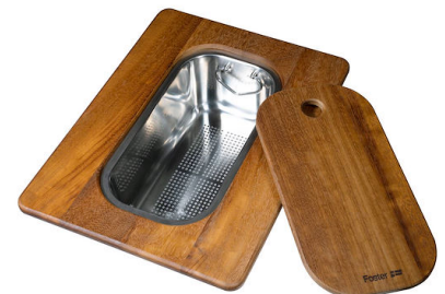
Tagliere Twin in legno Iroko con vaschetta scolapasta in acciaio inox