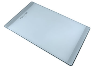
Tagliere in cristallo