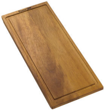
Tagliere legno noce