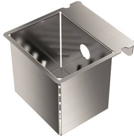
Vaschetta forata inox

* solo in abbinamento con l'accessorio 8644 101