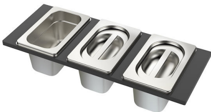
Set di 3 vaschette